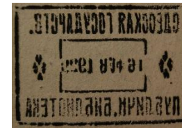
Stempel der Staatlich öffentlichen/Volks-bücherei Odessa

[1957 wurde bei einer dortigen Bestandsinventur das Buch als „absent“ vermerkt.]