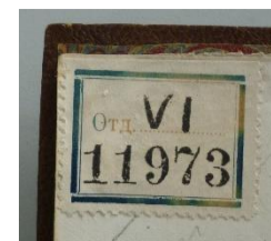
Etikett der Staatlich öffentlichen/Volks-bücherei Odessa